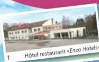
1 Hôtel restaurant «Enzo Hotels»