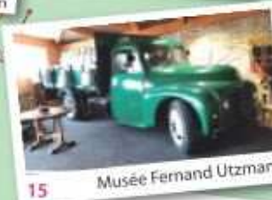
15 Musée Fernand Utzmann