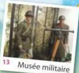
13 Musée militaire