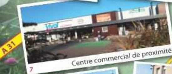
7 Centre commercial de proximité