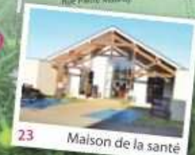
23 Maison de la santé

«Circuits de visite du bourg» «Circuits forestiers» «Les fontaines» guides et dépliants disponibles en Mairie. Edition 2022