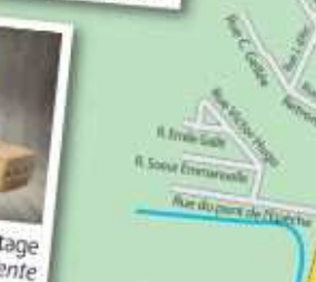
20 Lac des Récollets