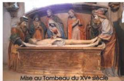
Mise au Tombeau du XV e siècle

Elle est dotée d'un patrimoine riche au niveau culturel comme la Mise au Tombeau du XV e siècle située dans l'église, très connue dans la région et même au-delà.