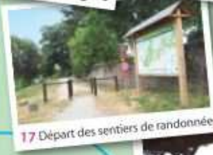
17 Départ des sentiers de randonnée