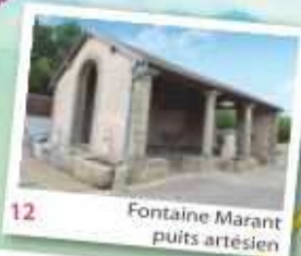
12 Fontaine Marant puits artésien