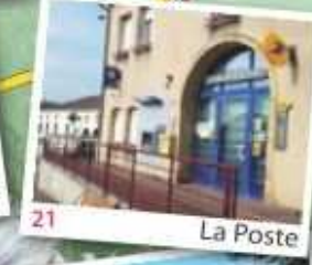
21 La Poste