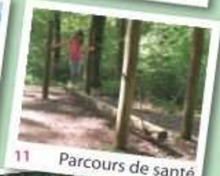
11 Parcours de santé