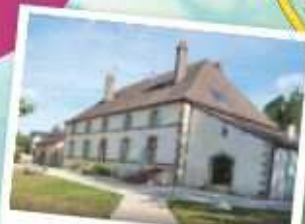
22 Chambres d'hôtes