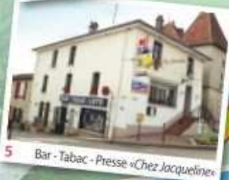
5 Bar - Tabac - Presse «Chez Jacqueline»