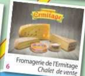
6 Fromagerie de l'Ermitage Chalet de vente