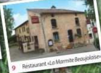
9 Restaurant «La Marmite Beaujolaise»