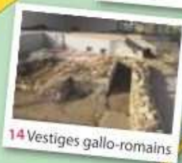
14 Vestiges gallo-romains