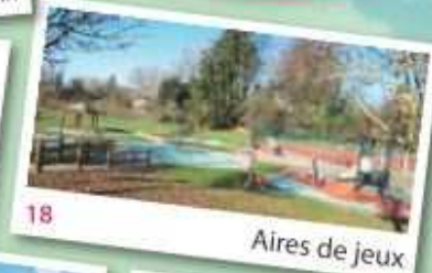
18 Aires de jeux