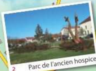
2 Parc de l'ancien hospice