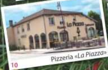
10 Pizzeria «La Piazza»