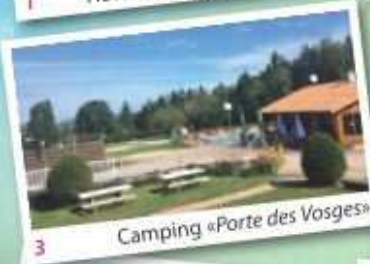
3 Camping «Porte des Vosges»