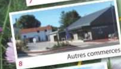
8 Autres commerces