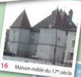
16 Maison noble du 17 e siècle