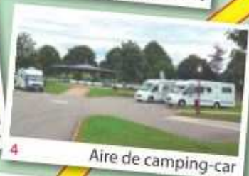
4 Aire de camping-car