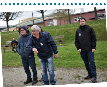
Au boulodrome, "on" reprend du service !