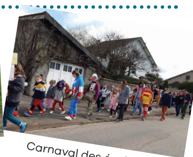
Carnaval des écoles