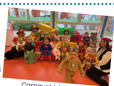
Carnaval à la crèche