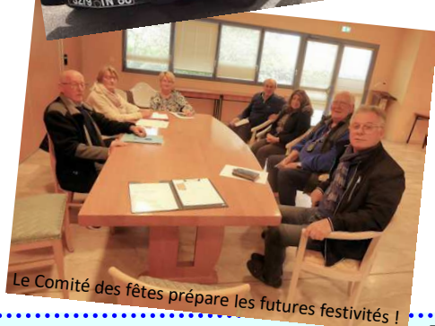
Le Comité des fêtes prépare les futures festivités !