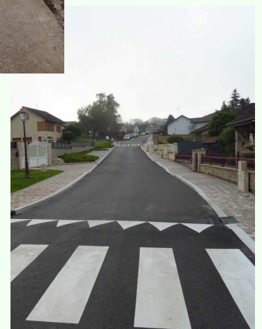
La rue du Faney en novembre