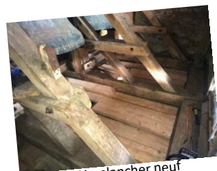
Un plancher neuf au clocher de l'église