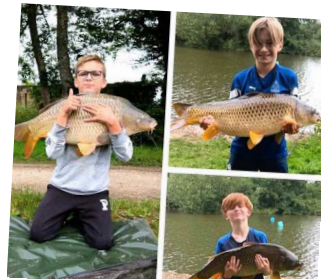
La valeur n'attend pas le nombre des années !