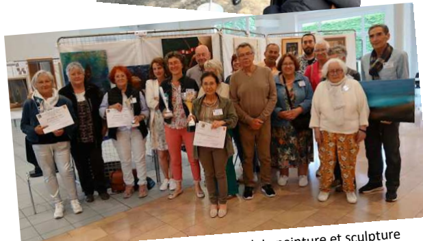
Les participants et lauréats du Festival de peinture et sculpture