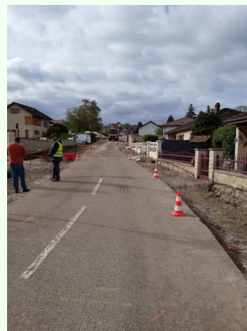
La rue du Faney en travaux en avril