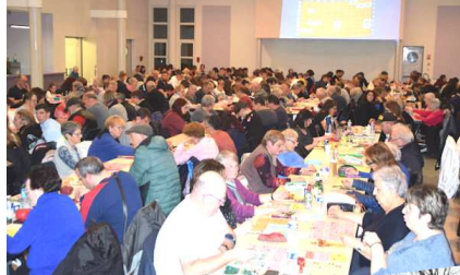
Beaucoup de monde au Loto de l'ADMR