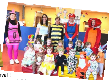
à l'école maternelle