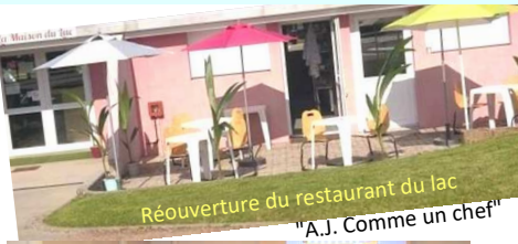
Réouverture du restaurant du lac "A.J. Comme un chef"

Événement organisé par le Comité des fêtes et les associations bulgnevilloises.